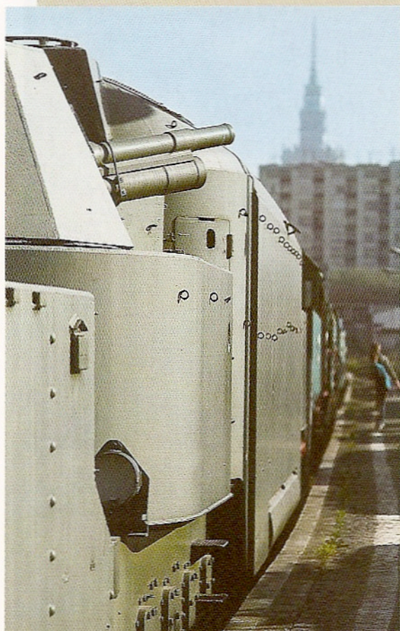
MACIEK BIERNACKI (2)